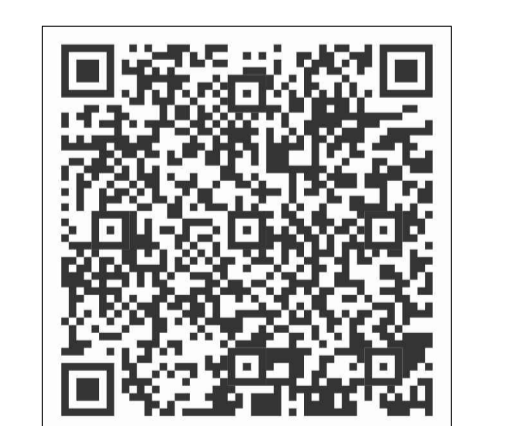
Installatie handleiding iPlus LCC

LET OP! Kabellengte tussen P-Switch en versterker maximaal 100 meter. Pas onder spanning zetten als alles is aangesloten. Belangrijk: Zie iPlusBus Installatie Handleiding